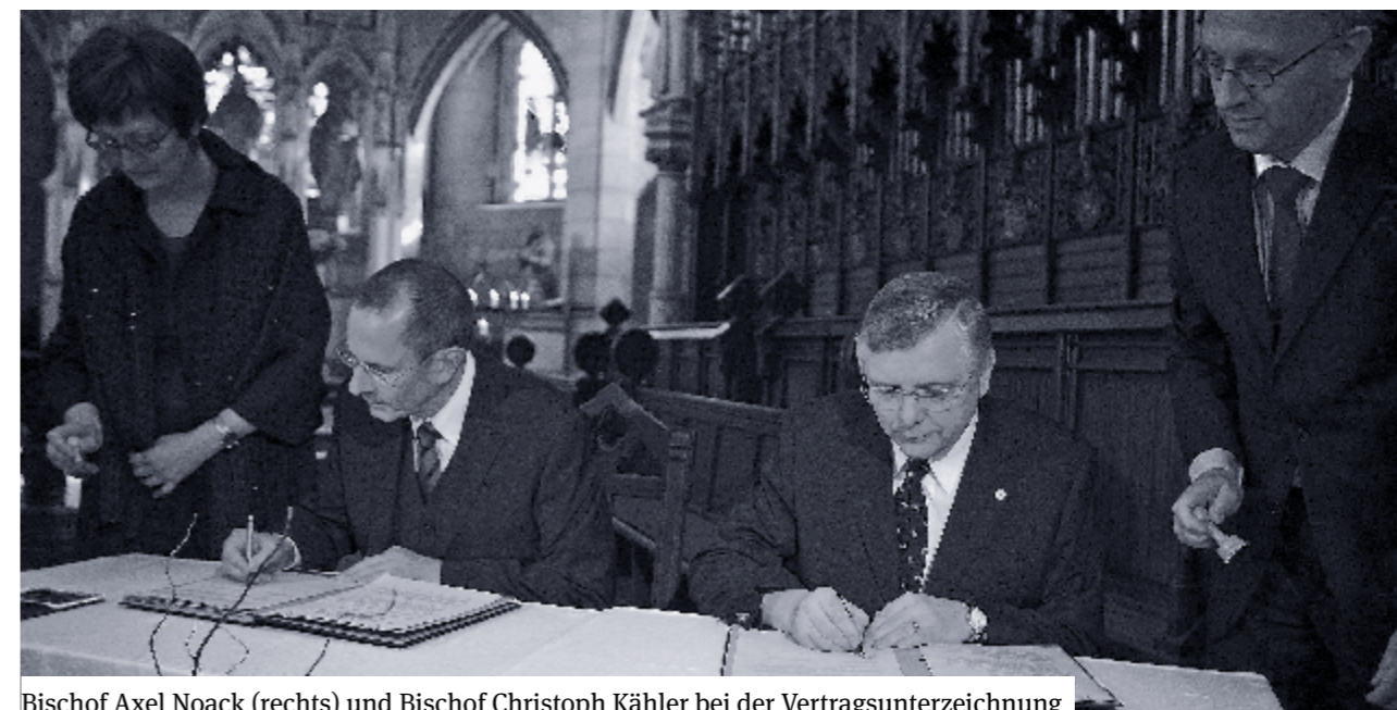
Bischof Axel Noack (rechts) und Bischof Christoph Kähler bei der Vertragsunterzeichnung

Bischöfin Junkermann: „Sich selbst groß zu feiern, ist sehr zwiespältig“