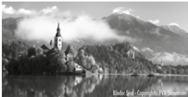
Bleder See

Zudem erwartet Sie ein Besuch auf der Burg Turjak mit der Dalmatin-Kapelle, dem slowenischen Pendant zur Eisenacher Wartburg. Diese diente slowenischen Reformatoren als Zufluchtsort. Jurij Dalmatin übersetzte hier die Bibel aus dem Hebräischen. Führungen durch die zauberhaften Altstädte von Ljubljana und Kranj, die mit mediterranem Flair verlocken, runden die Reise ab.