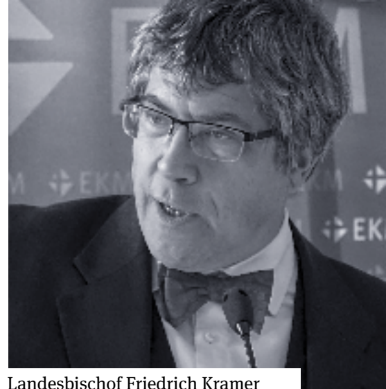
Landesbischof Friedrich Kramer